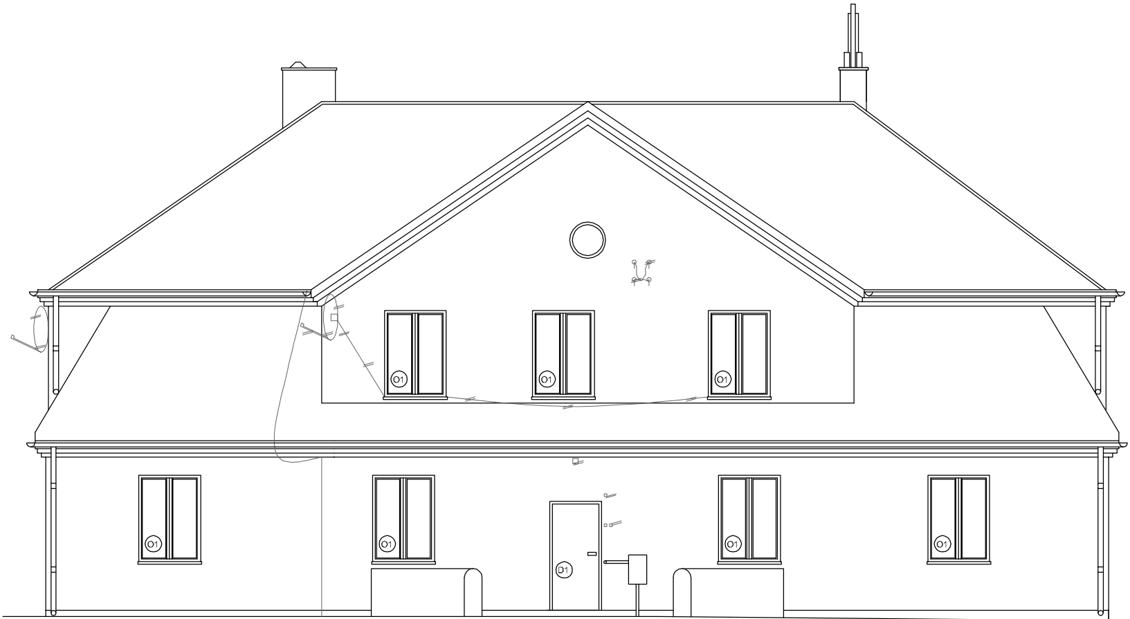
Elewacja tylna - wschodnia - widok elewacji